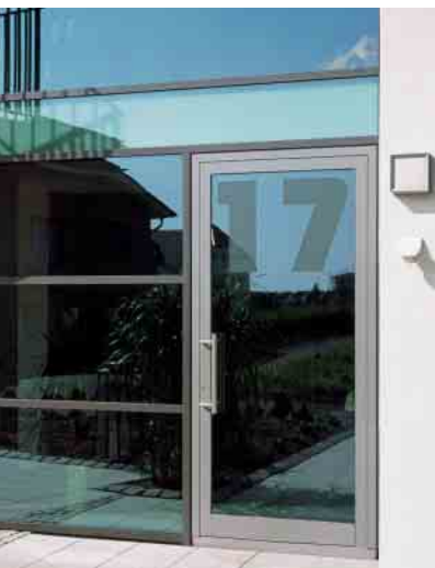
Schüco Aluminium-Türsystem ADS 50 Schüco Aluminium door system ADS 50